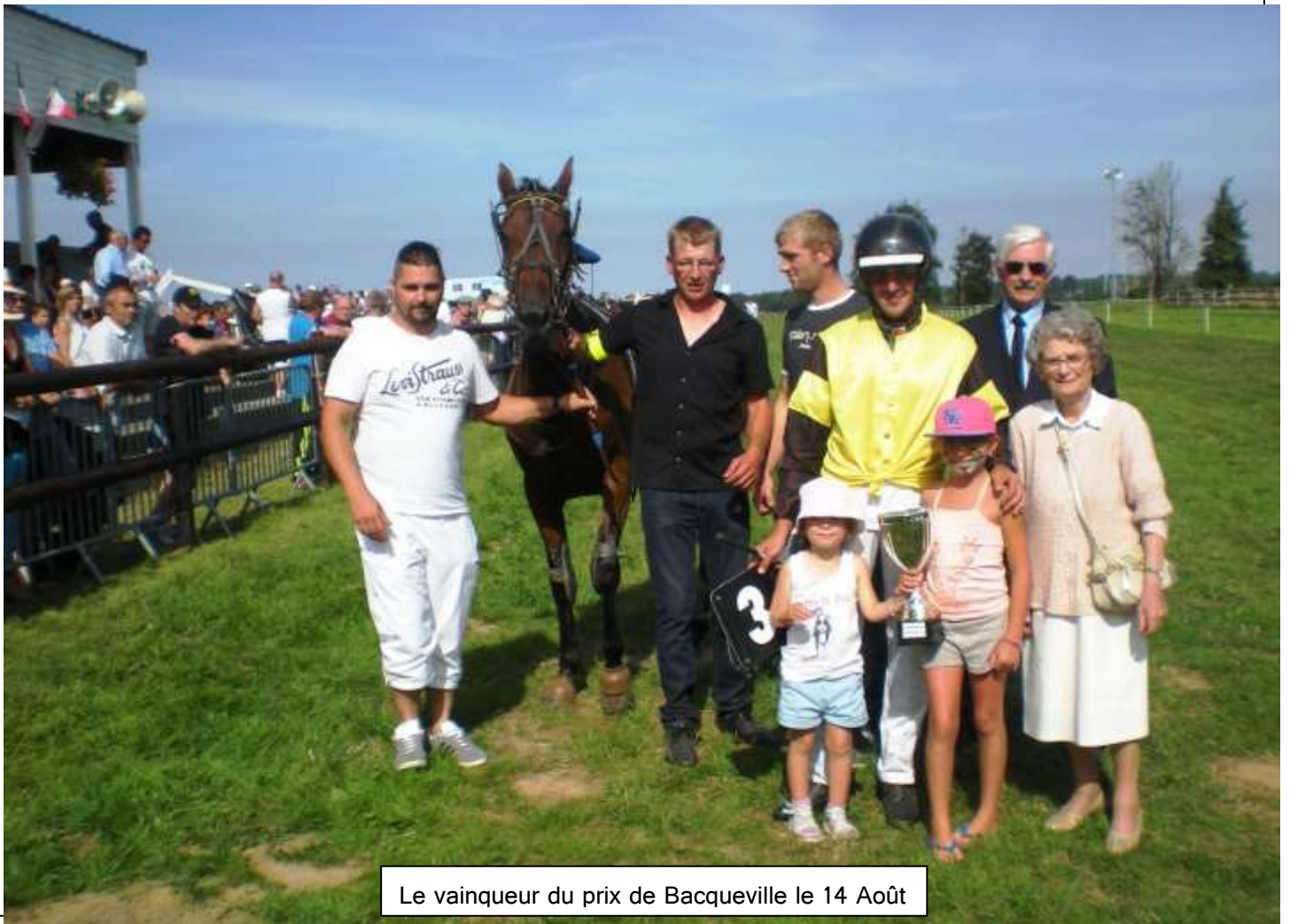
Le vainqueur du prix de Bacqueville le 14 Août