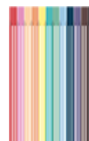
2 séries de feutres