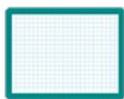
une ardoise blanche