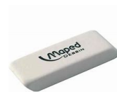
2 gommes blanche