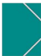
2 pochettes à rabats