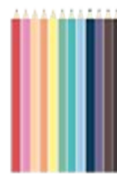
2 séries de crayons de couleur