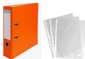
Un grand classeur + 100 pochettes transparentes

Afin d'éviter la perte de matériel lors des changements de classe :