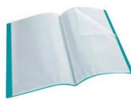
1 porte-vues A4 de 60 vues