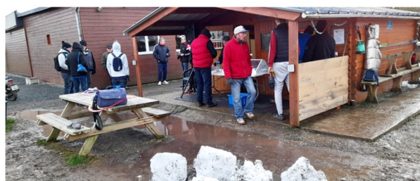
21 janvier, 1er concours de pétanque de l'année