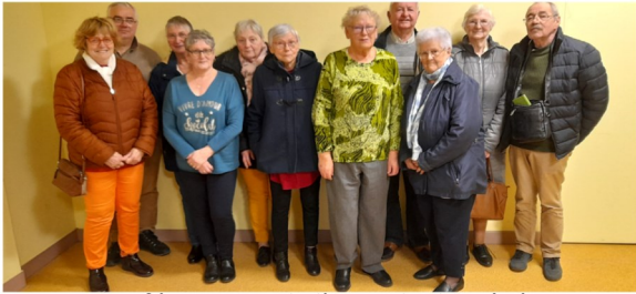
13 février, AG de l'amicale des aînés