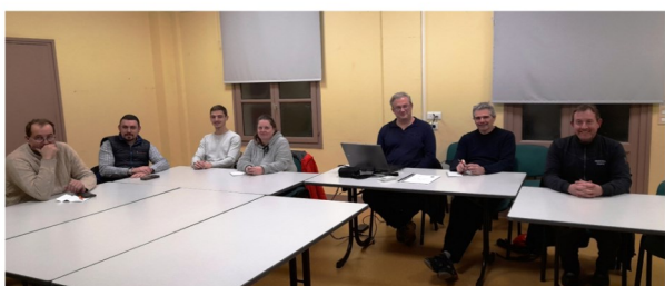
19 janvier, AG du Tennis club