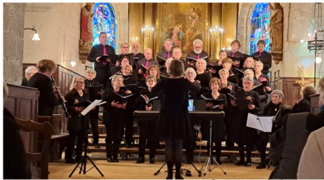
28 janvier, concert au profit du Téléthon