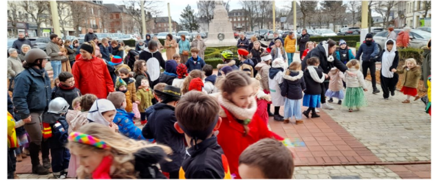
14 février, l'école St Léonard fête le mardi-gras