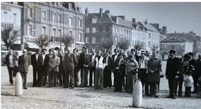
Français et Allemands réunis devant le monument aux morts en 1974

Les cérémonies de jumelage avec la signature de la charte auront lieu le 2 mai 1974 en Allemagne et en septembre de la même année à Bacqueville.