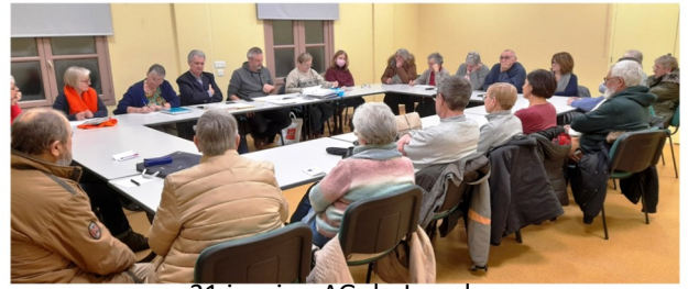
31 janvier, AG du Jumelage