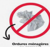
Ordures ménagères ou compost