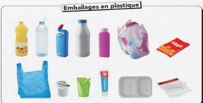
Emballages en plastique