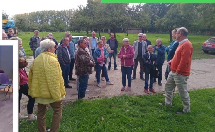
Visite de la ferme de Bonnetôt avec le jumelage