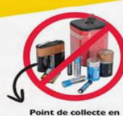
Point de collecte en magasin ou déchèterie