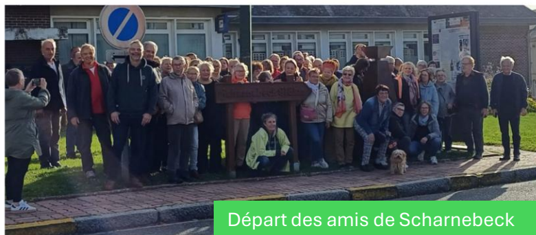
Départ des amis de Scharnebeck