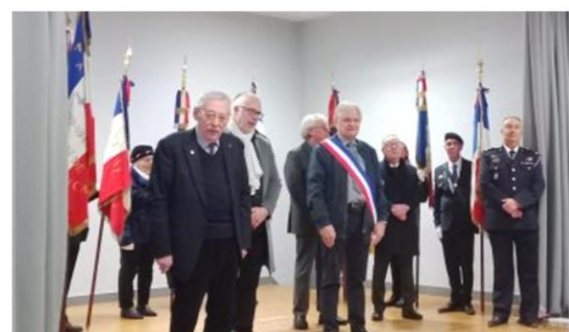
Hommage des Anciens Combattants d'Afrique du Nord