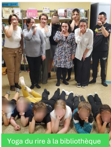
Yoga du rire à la bibliothèque