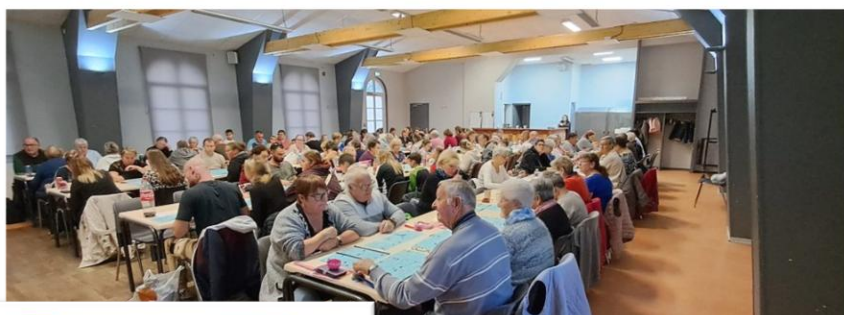
Loto des cochenilles