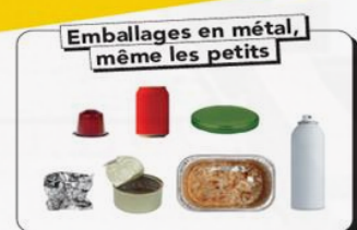
Emballages en métal, même les petits