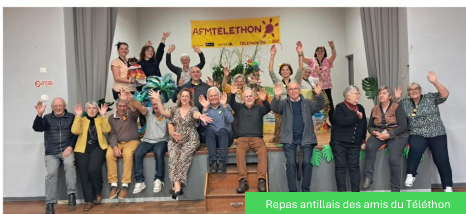
Repas antillais des amis du Téléthon