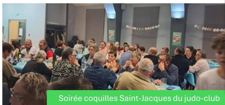
Soirée coquilles Saint-Jacques du judo-club