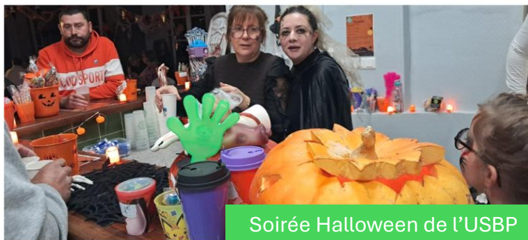
Soirée Halloween de l'USBP