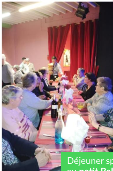
Déjeuner spectacle de l'amicale des aînés au petit Baltar à Nesle, dans la Somme