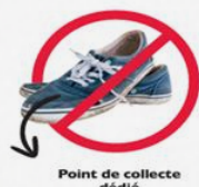
Point de collecte dédié