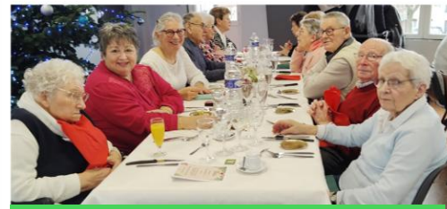
Repas de Noël de l'amicale des aînées