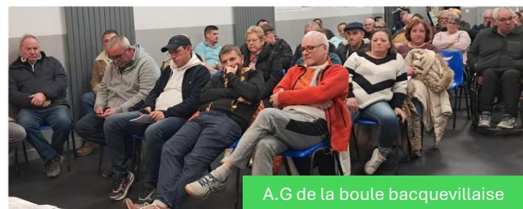
A.G de la boule bacquevillaise