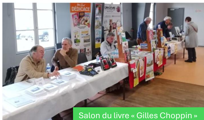
Salon du livre « Gilles Choppin »