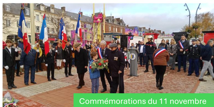
Commémorations du 11 novembre