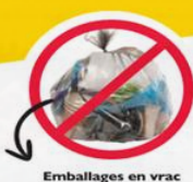
Emballages en vrac dans le bac de tri