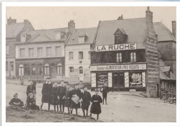
« Les p'tits besots de Bâcqueville »

Par extension et affectueusement, enfant dernier né d'une famille, surnom affectueusement donné à un jeune garçon.