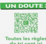
Toutes les règles de tri sont ici