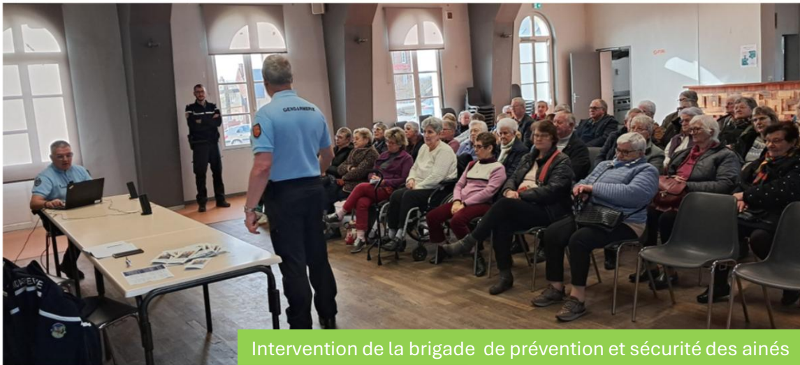
Intervention de la brigade de prévention et sécurité des aînés