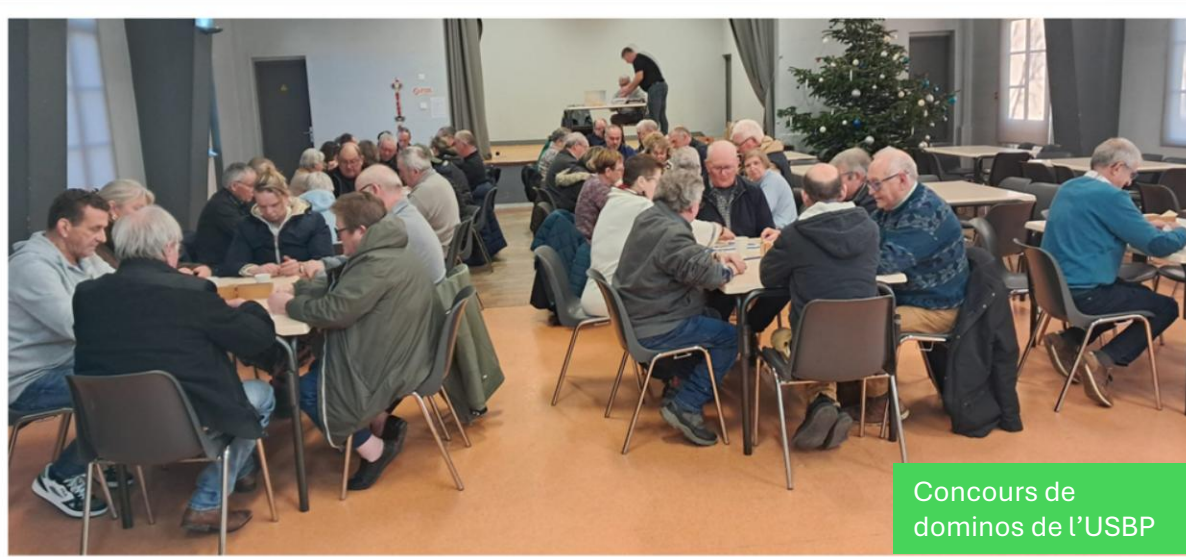
Concours de dominos de l'USBP