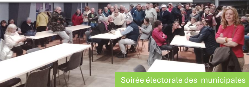
Soirée électorale des municipales