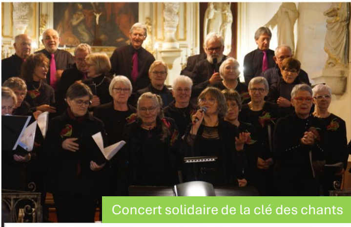
Concert solidaire de la clé des chants