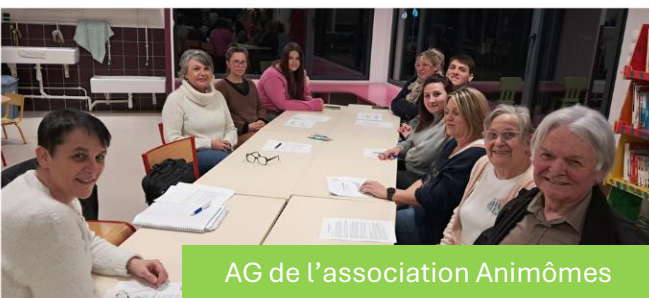
AG de l'association Animômes