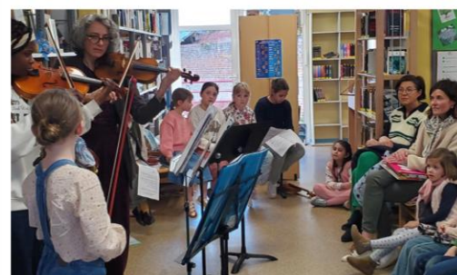
Printemps des poètes à la bibliothèque municipale