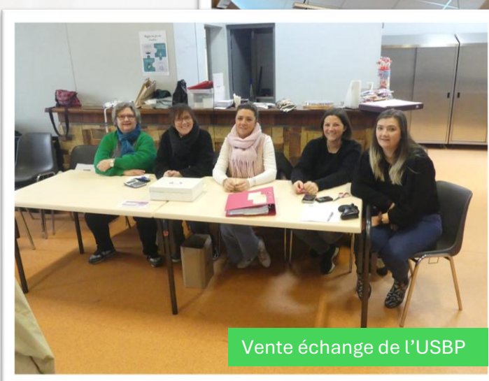
Vente échange de l'USBP