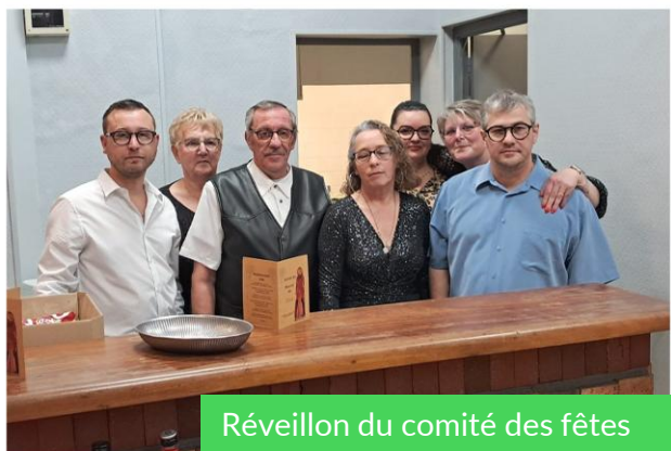
Réveillon du comité des fêtes