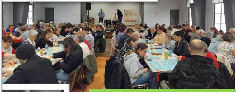
Loto comité des fêtes