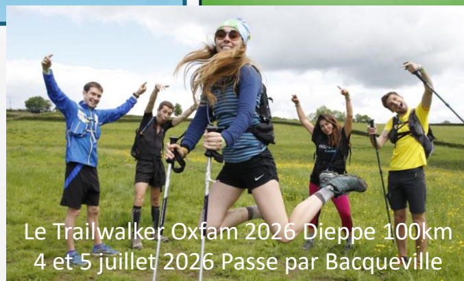
Le Trailwalker Oxfam 2026 Dieppe 100km 4 et 5 juillet 2026 Passe par Bacqueville

Vendredi 3 : Marché nocturne Mardi 7 : Goûter de l'amicale des aînés Dimanche 12: Cochon grillé de l'USBP 1 ère course hippique Lundi 13 : Feu d'artifice/Bal des pompiers Mardi 14: Fête nationale Dimanche 19 : Foire à tout de l'USBP Dimanche 26: 2eme course hippique