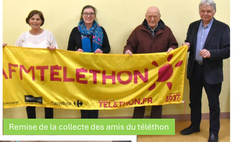
Remise de la collecte des amis du téléthon